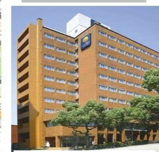
コンフォートホテル