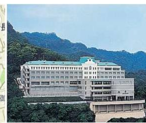
ルークプラザホテル (研修会会場)