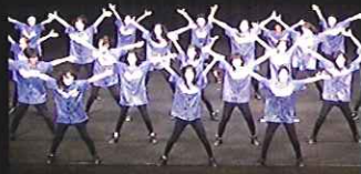
タケウチダンススクール

[共催] 宮崎県糖尿病対策推進会議・宮崎市・武田薬品工業株式会社 (講演のみ) [後援] NHK宮崎放送局・MRT宮崎放送・UMKテレビ宮崎・エフエム宮崎 MCN宮崎ケーブルテレビ株式会社・宮崎サンシャインエフエム・宮崎日日新聞社・読売新聞社・毎日新聞宮崎支局・朝日新聞社・夕刊テリヤク新聞社・株式会社宮崎中央新聞社 月刊パームス・宮崎市教育委員会・公益財団法人みやざき観光コンベンション協会・宮崎県・宮崎県教育委員会・公益財団法人宮崎県芸術文化協会・みやざき心のケア研究会 国際ソロプチミスト宮崎たまゆら・国際ソロプチミスト宮崎フェニックス・NPO法人みんなのくらしターミナル・NPO法人ハートム・村上三絃道後援会・宮崎市芸術文化連盟 NPO法人みやざき子ども文化センター・NPO法人宮崎文化本舗 (順不同) [お問い合わせ] 0985-22-5118 宮崎県糖尿病対策推進会議 (宮崎県医師会内)