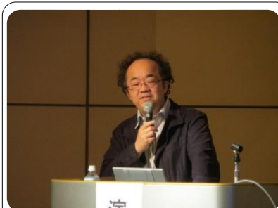
大悟病院認知症疾患医療センター